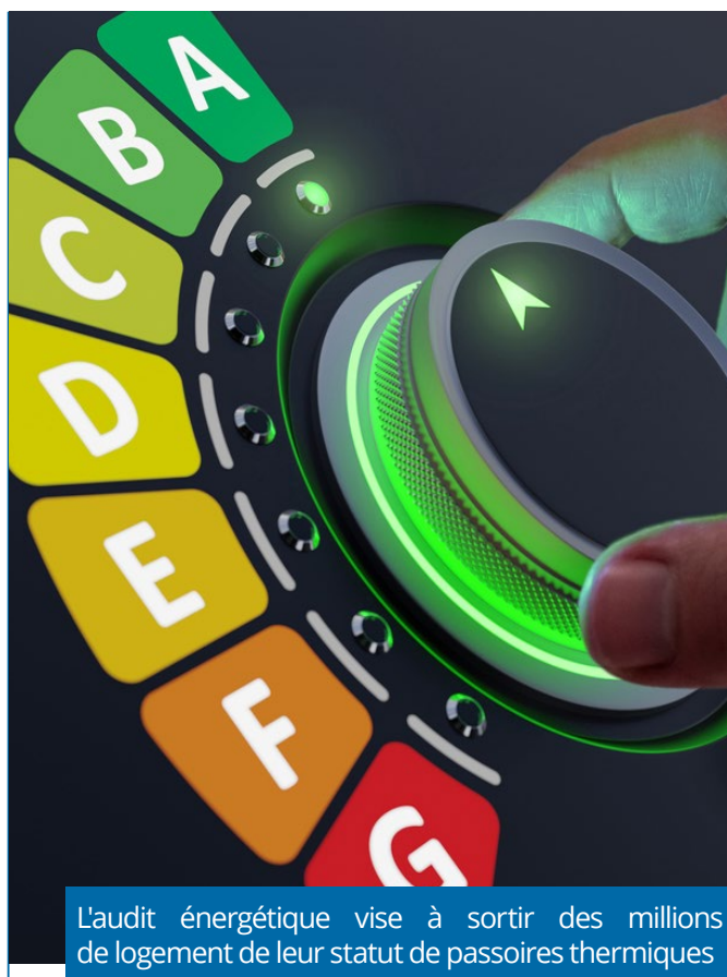
L'audit énergétique vise à sortir des millions de logement de leur statut de passoires thermiques

À qui faut-il faire appel ? Les compétences sont très encadrées par la loi. Les diagnostiqueurs immobiliers certifiés DPE, avec ou sans mention, peuvent