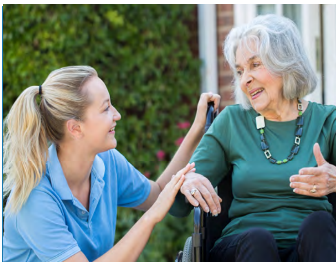
La dernière loi de finances a clarifié les modalités du crédit d'impôt pour l'emploi d'un salarié à domicile

Le dispositif « Louer Abordable », aussi appelé « Loi Cosse ancien », basé sur une déduction fiscale appliquée sur les loyers inférieurs aux prix de marché, fixés dans le cadre d'un conventionnement avec l'Agence nationale de l'habitat (Anah), est prorogé et, à cette occasion, totalement refondu. Le dispositif devait prendre fin le 31 décembre 2022 ; il reste finalement en vigueur sous sa forme actuelle pour les conventions déposées au plus tard le 28 février 2022. « Louer Abordable » est transformé en réduction d'impôt, ce qui simplifie sa lecture et uniformise l'avantage fiscal, quelle que soit la tranche d'imposition. Le taux de la réduction d'impôt est fixé à 15% pour le logement affecté à la location intermédiaire et à 35% pour le logement affecté à la location sociale. Des majorations sont prévues en cas d'intermédiation locative via un organisme agréé par l'État, portant le taux de défiscalisation à 20% en location intermédiaire, à 40% en location sociale et à 65% en location très sociale. Les plafonds de loyers ne seront plus basés sur les zonages A, B ou C, mais en fonction des loyers réellement observés sur chaque commune. Le taux de